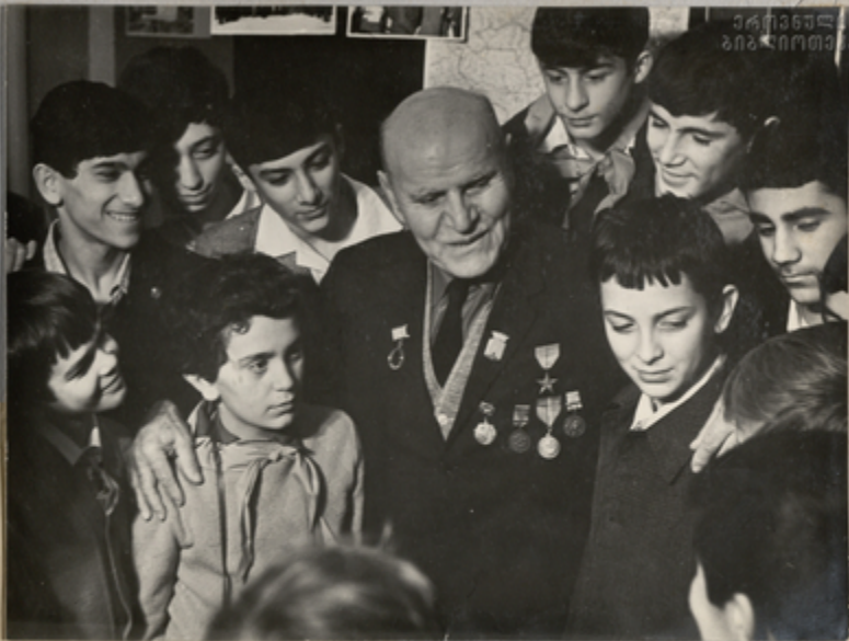
სტალინი & ვაჭაობელი ზაქარია მარჯანიძე

საბავშვო და სასკოლო წიგნების გამომცემელი საბავშვო და სასკოლო წიგნების გამომცემელი საბავშვო და სასკოლო წიგნების გამომცემელი საბავშვო და სასკოლო წიგნების გამომცემელი