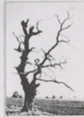
„მე ვიცი ზღაპრის მუხათა ვიცი“ მეტი გეგმების ფორტი

„მე ვიცი ზღაპრის მუხათა ვიცი“ მეტი გეგმების ფორტი „მე ვიცი ზღაპრის მუხათა ვიცი“ მეტი გეგმების ფორტი