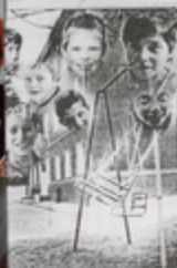
„მე ვიცი ზღაპრის მუხათა ვიცი“ მეტი გეგმების ფორტი

„მე ვიცი ზღაპრის მუხათა ვიცი“ მეტი გეგმების ფორტი „მე ვიცი ზღაპრის მუხათა ვიცი“ მეტი გეგმების ფორტი „მე ვიცი ზღაპრის მუხათა ვიცი“ მეტი გეგმების ფორტი