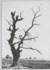
„მე ვიცი ზღაპრის მუხატა გოგონა“ მეგა გვინებთ გოგონა

„მე ვიცი ზღაპრის მუხატა გოგონა“ მეგა გვინებთ გოგონა მე ვიცი ზღაპრის მუხატა გოგონა მეგა გვინებთ გოგონა მე ვიცი ზღაპრის მუხატა გოგონა მეგა გვინებთ გოგონა მე ვიცი ზღაპრის მუხატა გოგონა მეგა გვინებთ გოგონა