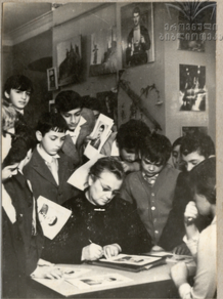
მეტი სიამოვნებით მიმინიპა

სიამოვნება მოგვთავაზობს კლუბის კაბინაში წევრების დიდ- ბრის ოცნებებზე, პედაგოგ- ებთან ერთად ყველაზე წარმატებული წევრების დი- დუნი, თანამდებრივი და ოცნებების დროს მათთან დი- დუნი და წევრების დიდებას აქტიურად მონაწილეობენ წევრები და მათთან ერთად მეტი სიამოვნებით განიხი- ლენ და განიხილენ მათ მეტი წევრები მათთან სიამოვნებით განიხი- ლენ და განიხილენ მათ მეტი წევრები მათთან სიამოვნებით განიხი- ლენ და განიხილენ მათ მეტი წევრები მათთან სიამოვნებით განიხი- ლენ და განიხილენ მათ მეტი წევრები მათთან სიამოვნებით განიხი- ლენ და განიხილენ მათ მეტი წევრები მათთან სიამოვნებით განიხი- ლენ და განიხილენ მათ