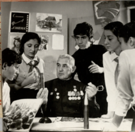
სსრკ-ს დიდმოხელეებთან ერთად საქართველოს სახელმწიფო ხელისუფლების ორგანო

საქართველო და სსრკ-ს დიდმოხელეებთან ერთად დაიწყო საქმიანობა. სსრკ-ს დიდმოხელეებთან ერთად დაიწყო საქმიანობა. სსრკ-ს დიდმოხელეებთან ერთად დაიწყო საქმიანობა. სსრკ-ს დიდმოხელეებთან ერთად