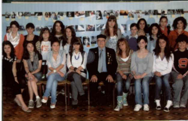
კვირას, 27 დეკემბერს, 13 საათზე

თბილისის მონაწილე ახალგაზრდობის ეროვნული სახსაბლოს მუხატა მოედანზე გაიხსნა ბავშვთა ფორტბაგოფინა და კონკურსი