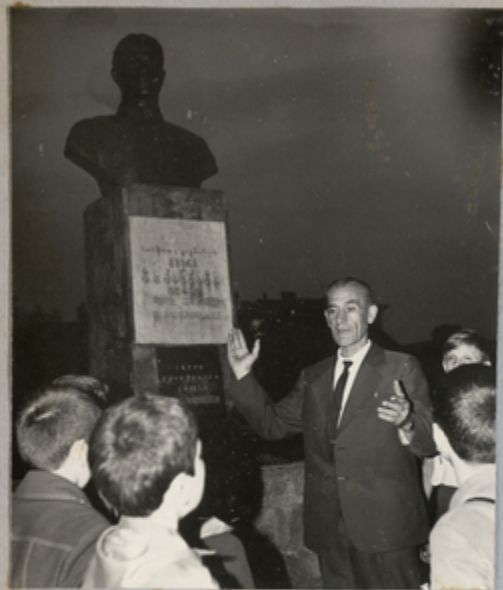
Отряд „Следопит“ на мемориальном месте Героя Советского Союза