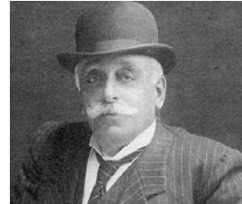
Ровом центре текстильной промышленности - Манчестере, изучая тайны ремесла.

Вскоре в самом центре армянской столицы, на улице Абовяна будет установлен памятник знаменитому предпринимателю, меценату и благотворителю Александру Манташеву. Автор памятника - заслуженный скульптор Армении Тигран Арумянян. Решение об увековечении памяти Манташева было принято еще в прошлом году. В настоящее время началось работы по подготовке участка, где будет установлен памятник. Александр Иванович (Ованесович) Манташев родился в Тифлисе (Тбилиси) в 1842 году, но большую часть детства провел в Тавризе (Иран), где его отец занимался торговлей текстилем. Был тесно вовлечен в коммерческие дела семьи. Работал и учился в тогдашнем ми-