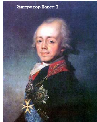
Император Павел I.