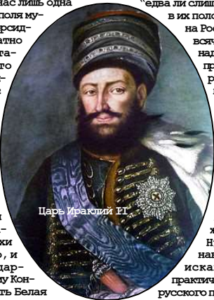
Царь Ираклий II