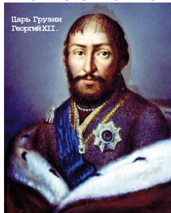
Царь Грузии Георгий XII.

Переход от договорных начал к инкорпорации, подчеркивает он, в случае с Грузией был совершенно иным. Исполнение Россией обязательств по трактату, по его мнению, равнялось их неисполнению: "покровительство" привело к разорению страны, сокраще-