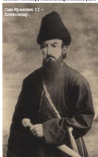
Сын Ираклия II - Александр.

ти, Грузия, Кахетия и Тифлис заключались в иранском государстве. Жители никогда под властью России не находились, кроме того случая, когда царь Ираклий вздумал, отторгнувшись от власти всегдашних владетелей своих, идти неприятельской против Персии степей... Зачем русский монарх желает унич-