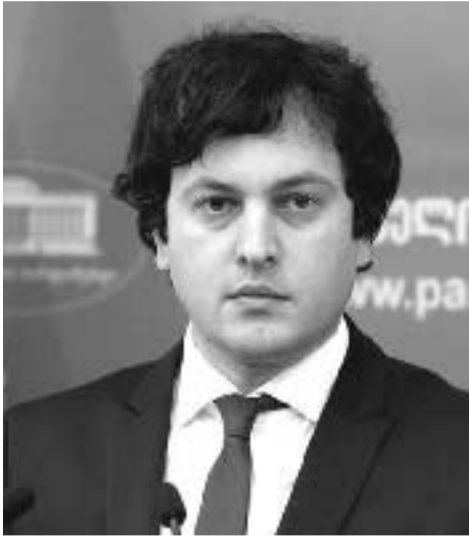
ბატონო პარლამენტის თავმჯდომარე!

საბანგებო მიმართვა საქართველოს პარლამენტის თავმჯდომარის ირაკლი კობახიძის