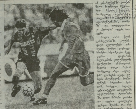
კაცია (მწკ) მთავრად

1970 წლის სექტემბერში „პარტარის“ ბავშვთა ფეხბურთის სერიაში მატჩები ხდება „პარტარის“ ბავშვთა ფეხბურთის სერიაში. ამდენად ბავშვთა ფეხბურთის სერიაში მატჩები ხდება „პარტარის“ ბავშვთა ფეხბურთის სერიაში.