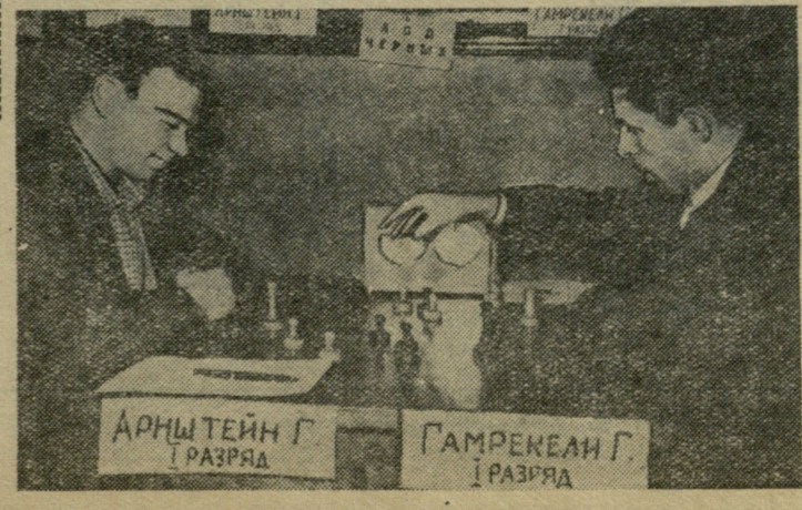
წარმატებით გრძელდება დედაქალაქის 1958 წლის პირველობა ხალკში. ეს გათამაშება თბილისის 1500 წლისთვის მიეძღვნა. სურათზე: ტურნიორის მონაწილეები გამრეკელი და არსტეინი თამაშის დროს.

ო. გელაშვილი, გ. სამსონაძე, ჩენი ხეც. კორ.