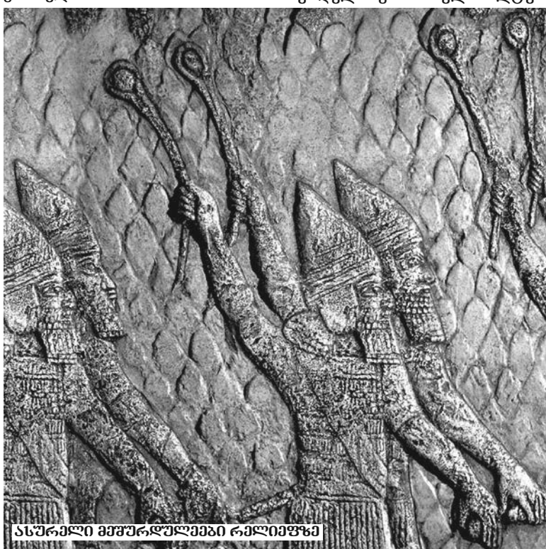
ასურული მემკვიდრეობები რაქიფიფში

საბჭოთა კავშირის დაშლის შემდეგ უამრავი საიდუმლო მასალა გაიხიდა საზღვარგარეთ. როგორც ჩანს, მედიკოსებშიც მოხდა გარკვეული მასალა და სწორედ მას შემდეგ დაგვიჩვენა „დისქვერმა“ გადაღება საქართველოში არსებულ საიდუმლო ადგილებზე. როგორც კულუარულად გავრცელდა ინფორმაცია, გადამღები ჯგუფის უფროსმა რადაც უცნაურობა აღმოაჩინა მთებში, თუმცა რა, არ გაახმაურა და რაც გადაიღეს, ჯერჯერობით არც ის არის საშუალო გამოხსენი.