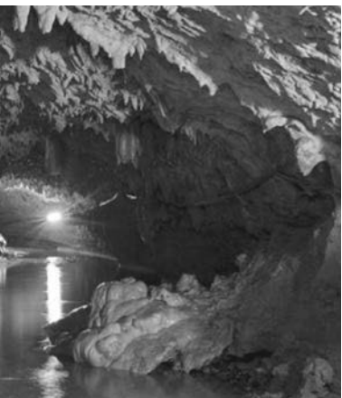
კადრი ფილმიდან „გიგანტის საფლავის საიდუმლო“

შურდულით გასროლილი ქვა დიდ მანძილზე მიექანებოდა და გასროლის სიძლიერითაც გამოირჩეოდა. შურდული იყო ტყავის ღვედი ან თასმა, რომელსაც შუაში ჰქონდა ჩაღრმავე-