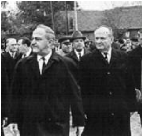
საპარტიოლოდან წასვლა და ბზა „მეზის რუსეთის საპარტიოლოში“

საქართველოს მწვერალთა შემოქმედებითი კავშირისა და საქართველოს მწვერალთა ეროვნული აკადემიის წევრი; უზრუნავისტა ფედერაციის წევრი; უმაღლესი კატეგორიის პედაგოგი; საქართველოს ტერიტორიული მთლიანობისათვის ბრძოლების მონაწილე; ნიკო ნიკოლაძის, გიორგი შარვაშიძის და ზეიად გამსახურდიას პრემიების ლაურეატი