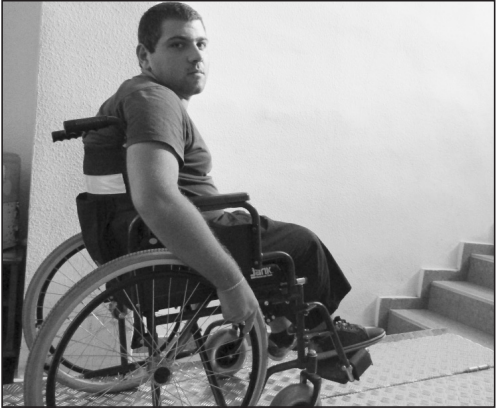
გაიმარჯვოს, როგორ უნდა აკეთოს სახელმწიფოებრივი საქმე ასეთი სიძურობის ფონზე?

ერთი რაღაც მინტერესებს, საპარლამენტო არჩევნებზე სოფლები – ბაილეთი, სილაური, ჯუმათი, ნავომარი, ძიძითი, ნატანები, წვერმაღალა და დაბა ურეკი სხვა საარჩევნო ოლქებში მოხვდნენ. თვითმმართველობის არჩევნებში როგორ იქნება? მეგობრები მყავს ამ სოფლებიდან და მათაც ხომ მიეცემათ ხმის მიცემის შესაძლებლობა?