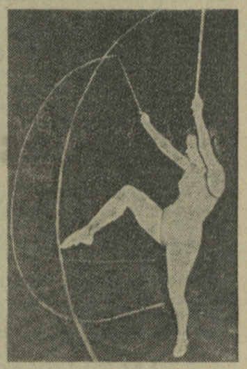
თბილისში დამთავრდა რესპუბლიკური პირველობა მხატვრულ ტანვარჯიშში. ანგარიში იხ. მე-4 გვ.