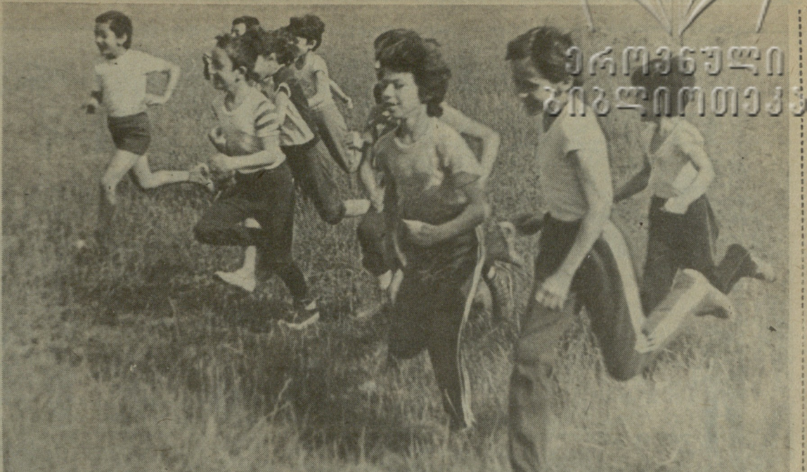
ამ ფოტოზე აღმებლილი გოგო-ბიჭები საქართველოს განათლების სამინისტროს აკრობატიკის რესპუბლიკური სპორტული სკოლის აღსაზრდელები არიან. ამჟამად ისინი თიანეთის სპორტულ-გამაჯანსაღებელ ბანაკებში იხვეწებიან და იწრებიან.

4 ტურის შემდეგ უკრაინის გუნდს 12,5 ქულა და ერთი გადადებული პარტია აქვს, ესტონეთისას — 8,5, საქართველოსას — 8 (1), მოლდავეთისას — 5,5, აზერბაიჯანისას — 5.