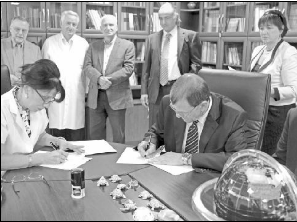
სამედიცინო ცენტრის“ (ყოფილი ონკოლოგიური ცენტრი) ხელმძღვანელი, პროფესორი:

და ახლაც დამსწრე საზოგადოება მორიგი, სრულიად უნიკალური პროექტის დაგვირგვინების მოწმე შეიქნა – აპარატი, რომლის შექმნასაც მოეწერა ხელი, გასწავთ ცნობილი ამერიკელი ფირმა „ვარიანის“ წარმომადგენლებს – „თრუბიმის“ მოდელის და ბოლო ენერჯის სხივური ამარქარებელი – თანამედროვე ონკოლოგიაში სხივური თერაპიისთვის განკუთვნილი ბოლო თაობის ერთ-ერთი საუკეთესო დანადგარი.