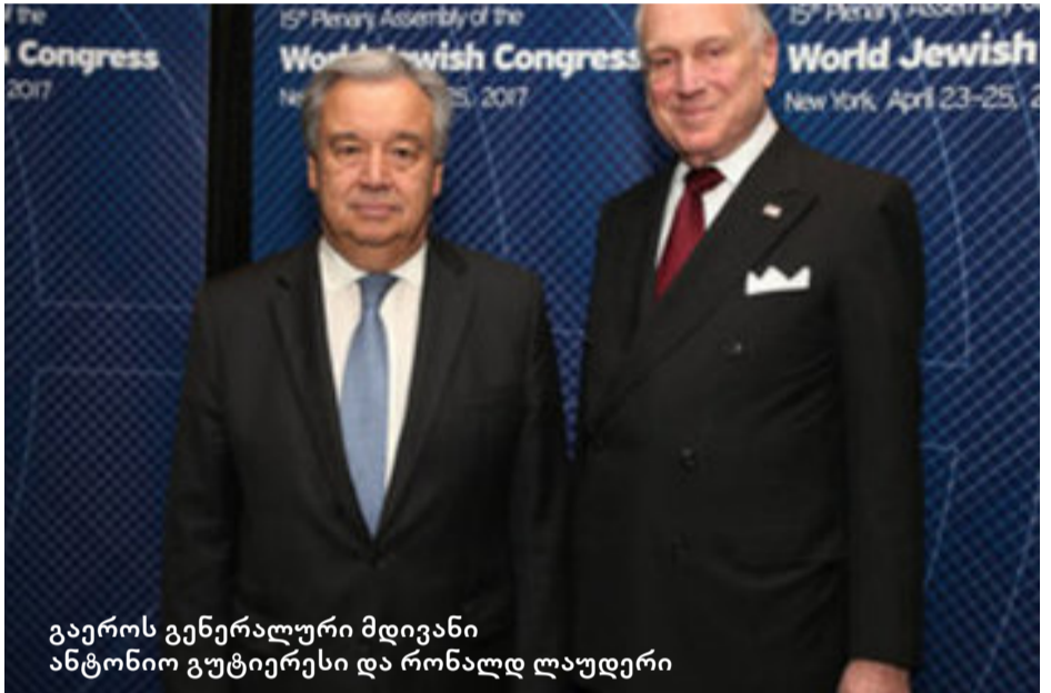
გაეროს გენერალური მდივანი ანტონიო გუტიერესი და რონალდ ლაუდერი

გენერალურ ასამბლეაზე სიტყვით გამომსვლელმა ევროპის ებრაელთა კონგრესის პრეზიდენტმა მოშე (ვიჩესლავ) კანტორმა ასეთი საგან-