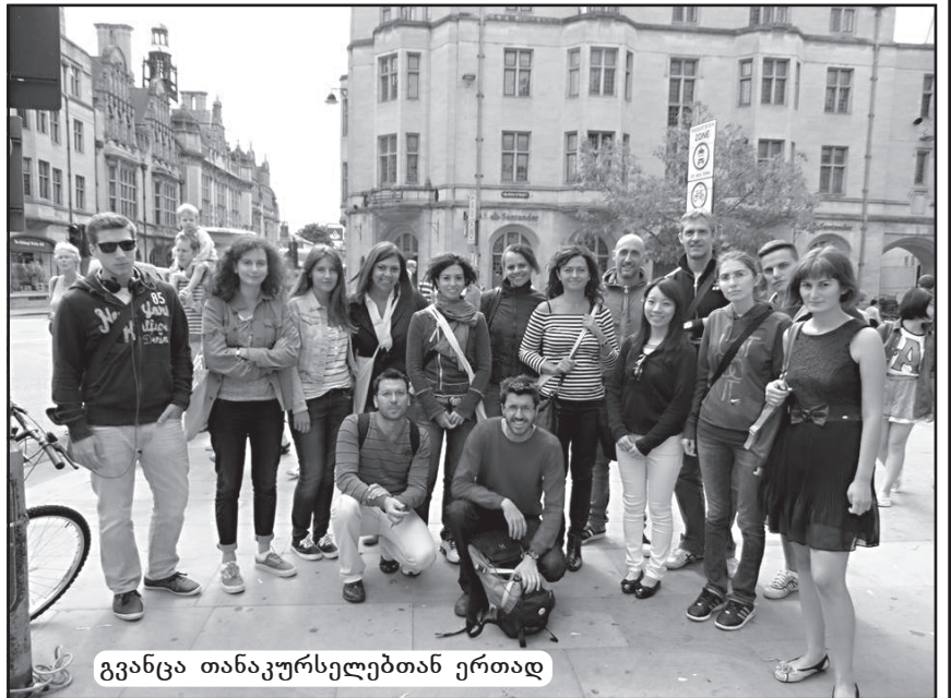
გვანცა თანაკურსელებთან ერთად

„2013 წლის აგვისტოს, სრულიად მოულოდნელი სასიხარულო ამბავი გავიგე – დიდ ბრიტანეთში მივემგზავრებოდი, რათა გაგვევლო 2-კვირიანი ინგლისური ენის კურსები ლონდონის სკო-