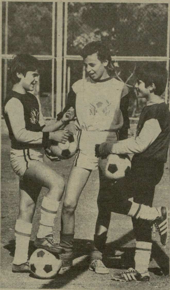
ნ. მ. 3 33.

35-ე სკოლაში ახლანახალი ახალმოსწავლეები იდენსასწავლა. ახალ შენობაში არის კარგად მოწყობილი კაბინეტები და ლაბორატორიები, სპორტული დარბაზები, ვასაბდელები და საშხაპეები, სასადილო,