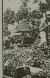
საგარეო ურთიერთობების მინისტრის განცხადებით