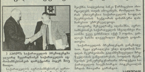
3 აპრილს საქართველოს პრეზიდენტმა გიორგი მუხომბეძემ საქართველოს მთავრობის წევრებს შეხვედრა გამართა, სადა სოფლის მეურნეობის განვითარების შესახებ განიხილეს.

საქართველოს აგრარული მინისტრის განცხადებით, სახელმწიფო მხარდაჭერის გარეშე სოფლის მეურნეობის განვითარება შესაძლებელია.