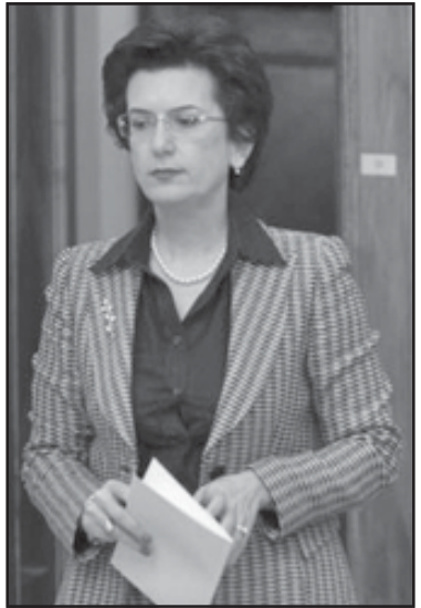
ნინო ბურჯანაძე, აშშ-ში მსტარა, რომელიც აშშ-ის სახელმწიფო დეპარტამენტში მსახურობდა...