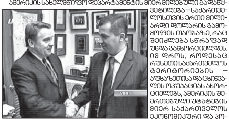
ამერიკის სახელმწიფო დეპარტამენტის მიერ მიღებული გადაწყვეტილება - საქართველოსთვის ერთი მილიარდი დოლარის გამოყოფის თაობაზე...