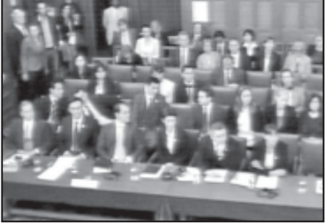
რუსეთის ფედერაციისთვის დროებითი ღონისძიების დაკისრების შესახებ.