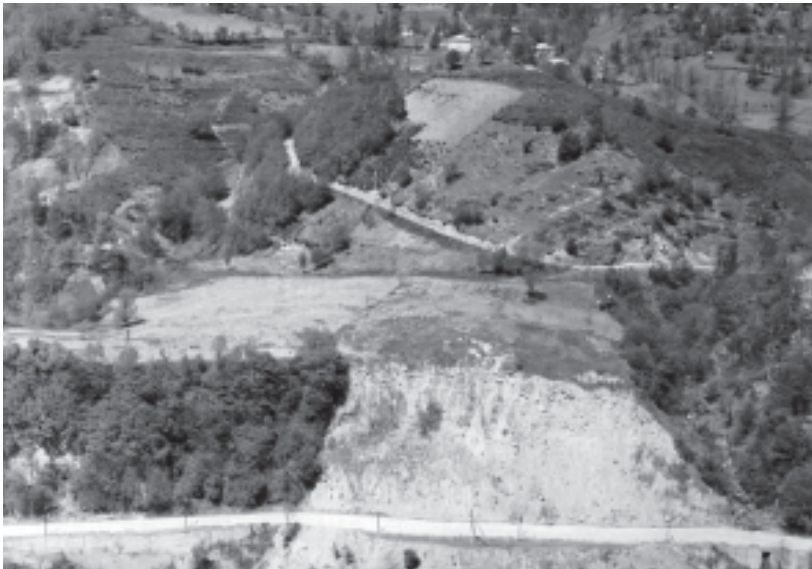
თამაზ მეთის ნაძახბაზუჯი ადგილი