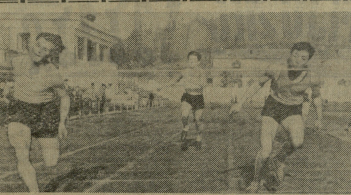
აფხაზეთის „კოლმეურნე“ ჩაატარა საოლქო პირველობა...