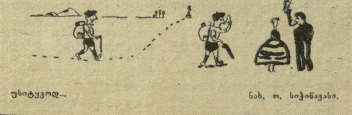
უხიტკოვლ... ნახ. თ. სიჭინავისი.