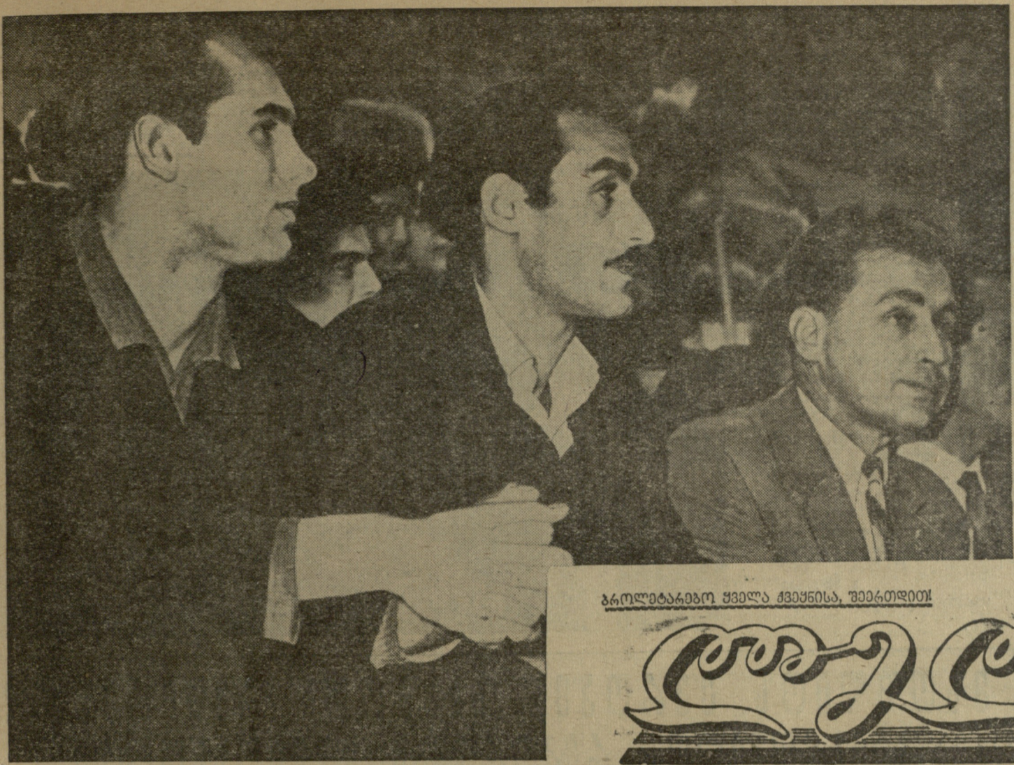
ბრომბარგო ყველა ქვეყნისა, უპარტიოთ.