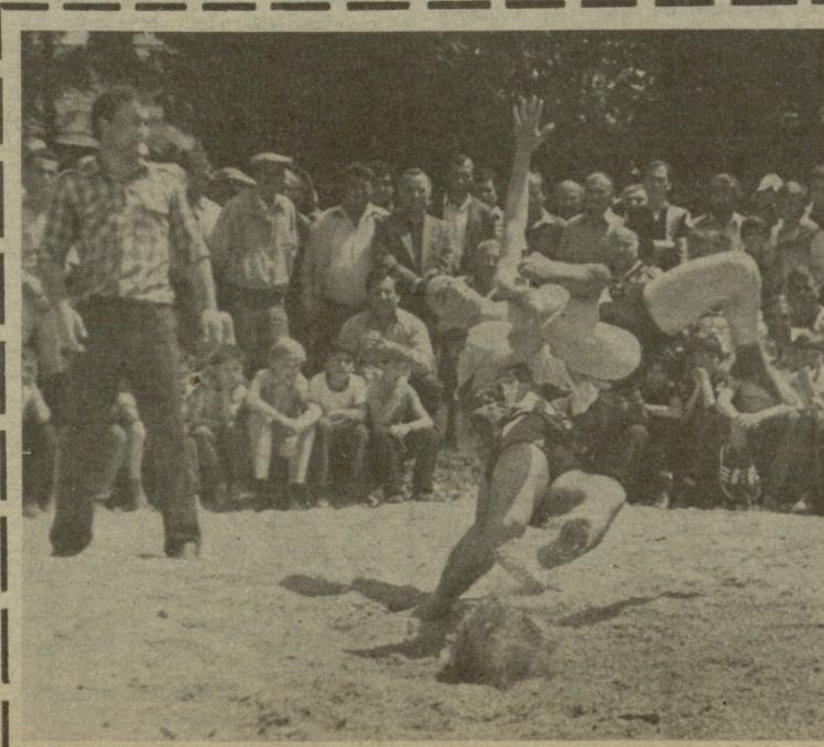
17 მაისს მთელ ჩვენს რესპუბლიკაში ჩატარდა შეჯიბრებები ქართულ ჰიდაობაში. ეს დონისიება სპორტის ეროვნულ სახეობებზე საყოველთაო ზრუნვის დემონსტრირებად იქცა. ადგილებზე ამ შეჯიბრებათა ჩატარებაში სპორტკომიტეტებს დიდი დახმარება გაუწიეს კომპაგნიურულმა ორგანიზაციებმა. ქართული ჰიდაობის დღისადმი მიძღვნილ მასალებს მითხველი ჩვენი გაწვევის უახლოეს ნომერში გაეცნობა. სურათზე: ახმეტაში გამართული ერთ-ერთი ასპარეზობის მომენტი.

ბოლო შეჯიბრებზე რას იტყვით? — ერთიცა და მეორეც ზორგატისა და სლოვენის გათავისუფლების თარიღს მიეძღვნა. შეჯიბრება ზაგრებში ოცდამეორეშედეგად, სურათზე ხედავთ „სპორტსკე ნოვოსტის“ პირველ გვერდზე, ჯდაც (მარჯვენა ზემოთ) დაბეჭდილია სტრიჟაკოვის ფინიში ზაგრებში.