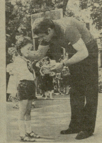
ალექსანდრე კოტორაშვილის ფოტოები.

სურათებზე თქვენ ხედავთ თბილისში, სპორტის სახანის ტერიტორიაზე გამართული ღონისძიების ფრაგმენტებს. წარსულში ცნობილი ველომრბოლელი ომარ უსნაძე (ქვევით) ჩილდოს გასაცემს ბავშვთა შორის შეიბრებაში გამარჯვებულს.