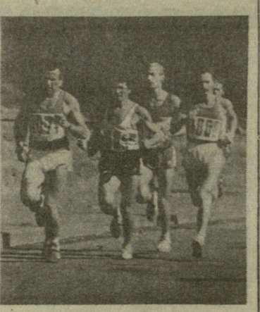
და უფროსი ასაკის მორბეულებს. ქალთა (10 კმ) და ვაჟთა დისტანციებზე (20 კმ) რბენაში მქვსივე პრიზიორი დაბლომებითა და პრიზებით, 20 კმ-ზე და მარათონში გამარჯვებულები კი დიპლომებით, პრიზებით და ფასიანი საჩუქრებით დაჯილდოვდებიან.

ლათვის 10 და 20 კმ-ზე, ვაჟებისთვის — 20 კილომეტრზე და სრულ მარათონულ დისტანციაზე — 42 კმ და 195 მეტრზე. შეჯიბრებაში მონაწილეობას მიიღებენ სპორტსაზოგადოებების, სპორტული კლუბების, სპორტული სკოლების გუნდები, ამიერკავკასიის სამხედრო ოლქის სპორტკლუბის წევრები. სტარტზე გამოხვალა შეუძლია ყველას, ვინც წინასწარ წარმოადგენს სამედიცინო ცნობას. მათ კი, ვისაც ქალთა შორის 20 კმ-ზე და ვაჟთა მარათონში გამოსვლა სურთ, თან უნდა იქონიონ სამედიცინო ცნობა — ფორმა № 227. მონაწილეთა შეკრება და სტარტი დანიშნულია 1 ნოემბრისთვის თბილისის ზღვაზე, თეშქის დასახლების მხრიდან. ავტობუსები 10.30 საათამდე საქართველოს სპორტსახომადე (ქავკავადის პრ. № 49) დაელოდებიან შეჯიბრების ნახვდს და მასში მონაწილეობის მსურველებს. მარათონში მონაწილეობის უფლება აქვთ 1970 წელს დაბადებულ