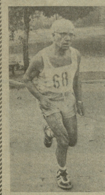
საინტერესო მძლეოსნური კროსი

სპორტული ბაზების ნაკლებობა ხშირად ვეჩივით და ამის საფუძველიც გაქვს, მაგრამ ძველი, ტრადიციული შეჯიბრების ადგილებს რატომღაც ვივიწყებთ. კუს ტბის გარშემო, მაგალითად, ტრადიციული საშემოდგომო კროსები იმართებოდა. ეს ადგილი პირდაპირ ზედამოჭრილია მძლეოსნური ასპარეზობებისათვის: ამ პარტია და ლამაზ წყალსაცავს და მის უღამაზეს გარემოს თვით ლისის და თბილისის ზღვის მიდამოებზე ვერ დაუდებენ ტოლს, რომ აღარაფერი ვთქვათ მის კიდევ ერთ ღირსებაზე — იგი ხომ ქალაქიდან ხელს გაწვედნაზეა.