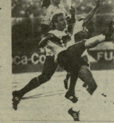
ევროპის ჩემპიონატის მატჩი: გურ - პოლანდია: უკანა პლანზეა გულიტი.