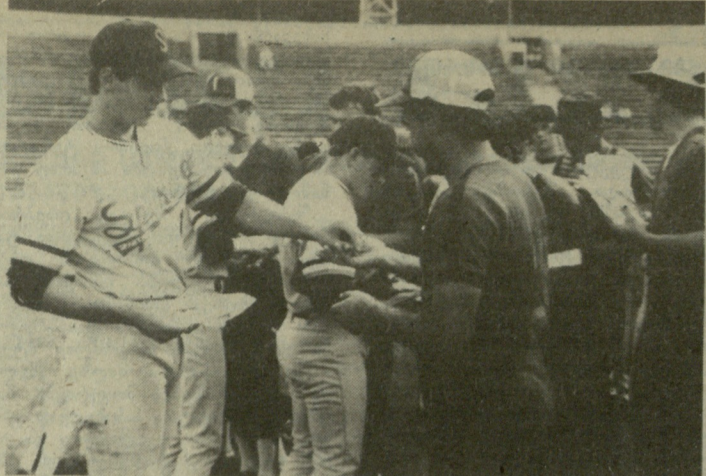
შარშან ქართველმა ბეისბოლისტებმა ჩეხოსლოვაკიელებს უმასპინძლეს, წელს კი ამერიკელებს დაუმეგობრდნენ.