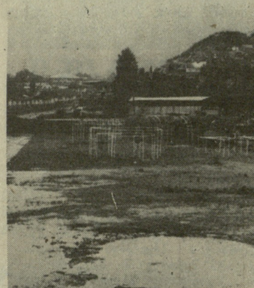
ალწივს — კოოპერატივის ჩამოყალიბება დაამტკიცეს.

კიდევ ბევრ საქმეს შეგვიდინე. საქმეში გაერთიანებს შეგებულებები გადავიწყობთ. თუმცა, კოოპერატივი დამტკიცებული ჯერ არც იყო. მათ ამ საქმეშიც უამრავი წინააღმდეგობა შეხვდით და, ბოლოს, თავიანთი მცდელობით მიხანს მი-