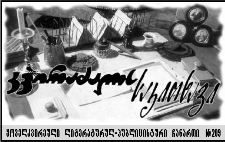
ყოველკვირული ლიტერატურულ-პუბლიცისტური ჩანაწერი №209

მსოფლიო ფილოსოფიური კონგრესი იმართება ხუთ წელიწადში ერთხელ და მეტად მნიშვნელოვან ყველასთვის საყოველთაო კულტურულ მოვლენად განიხილება.