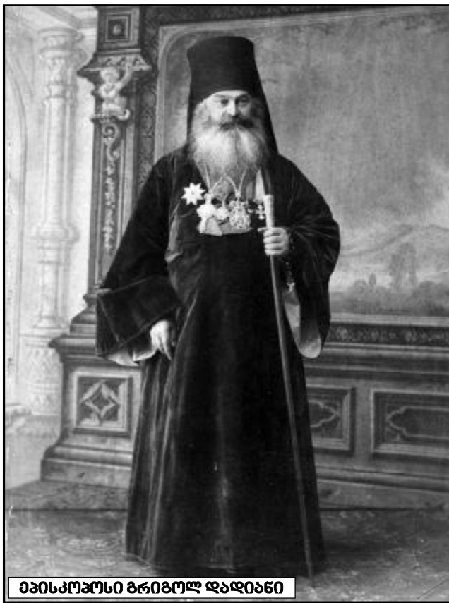
ეპისკოპოსი გრიგოლ დადიანი

– ცოტა არ იყოს ეს ანდაზა იგზუტურიაო, – ამბობს მგოსანი და იქვე აგრძელებს – გარდაცვლილს იმიტომ არ იხსენებენ, რომ იმას რამე შეასმინონ, არა-