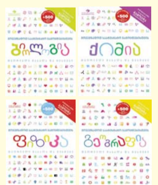
თითო კრებულის ფასი - 10.90 ლ

კრებულში შესულია პროგრამით გათვალისწინებული თეორიული მასალა და ტესტები. გადასახვევი ფენის ქვეშ მოთავსებულია უნიკალური კოდი. ეს კოდი შეიყვანეთ სპეციალურ აპლიკაციაში, რომელიც განთავსებულია გამოცდების ოფიციალურ ვებ-გვერდზე fb.com/bakursulakauripublishing ერთი კოდის გამოყენება შეუძლია მხოლოდ ერთ მომხმარებელს. ელექტრონული ტესტები შეიქმნება ჩაბარების როგორც თემების მიხედვით, ასევე შერეულად.