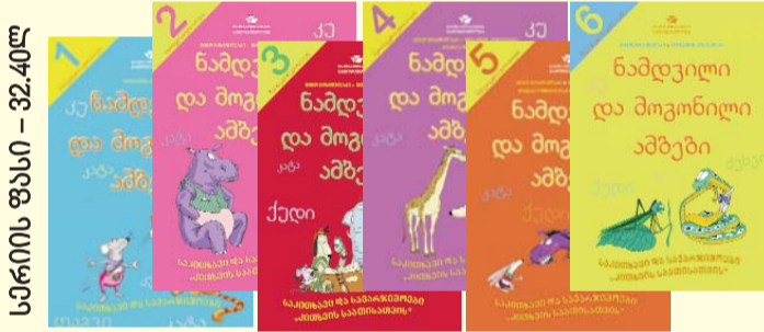
საბავშვო ფასი - 32.40 ლ

საბავშვო ნაწილი I-VI კლასების მონათვლებისათვის, „მონათვის საათის“ საკვირივი გათვალისწინებით.