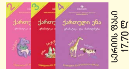
საბავშვო ფასი 17.70 ლ

ეროვნული სასწავლო გეგმით გათვალისწინებული გრამატიკის თეორიული კურსი და სავარჯიშოები.