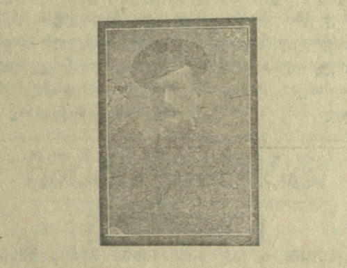
გიორგი ალექსანდრის ძე ლაპაშვილი საღატურის რაიონის სამხ. გვარდიელი. — მას. № 3 ჯავშნისან მატარებელზე—გარდაიცვალა 4 სექტემბერს.