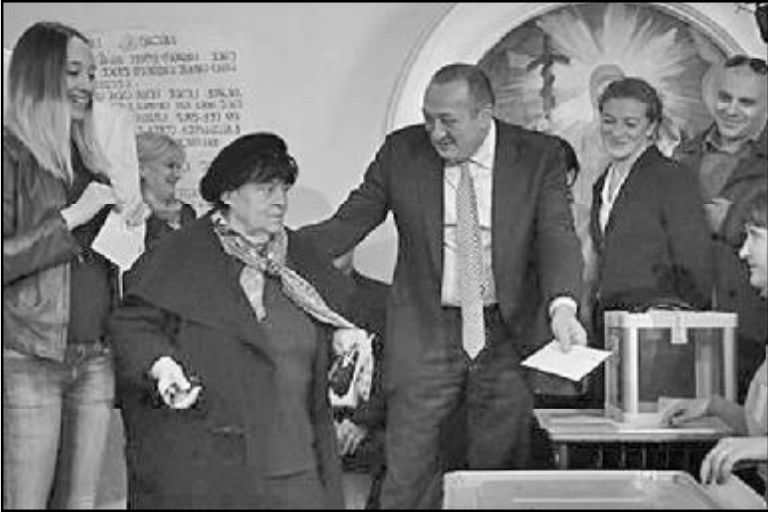
ადრინანდ მივედი საარჩევნო უბანზე. დაუსწრია მეზობელს — უკვე გამოდიოდა შენობიდან.