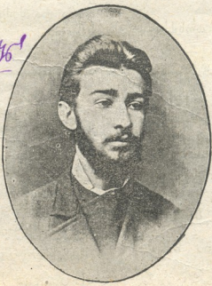
მწიგნობარი ილია ხონელი (ბახტაძე) (გარდაცვ. 10 წ. შესრულების გამო. + 13 ივლ. 1900 წ.)