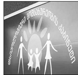
რაპეუტი და სხვები, ასევე ტექნიკური მუშაკი, რომელიც მოამზადებს პროექტებს“.