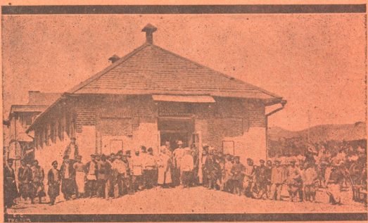
ავჭალის აუდიტორია, სადაც პირველად სახალხო წარმოდგენები დაიწყო