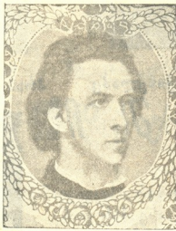
ფრედერიკ შოპენი პოლონეთის გამოჩენილი მუსიკოსი

რადც უხილავმა ბუნების ძალამ მრავალჯერ დაასაუქრა კაცობრიობა დიდებული შემოქმედების ნიჭით აღჭურვილ პირებით. ეს კიდევ არაფერი: შეიძლება ნიჭი, ჯერ კიდევ აღუყვავებელი, ჩაიხშოს, ხოლო მრავალჯერ-კი; მიუხედავად ათასნაირ დამბრკოლებელ გარემოცა, შარვანდელით მბრწყინავი