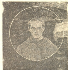
პრაპ. ი. პაპუაშვილი

ცივი ქარი ჰქრის ..გაყვილებული მქენარი ფოთლები ძირსა სცივიან და გულსაკლავად ასე პგოდებენ, ასე მოსთქვამენ, ასე ჰსჩივიან: „ჩვენი სიცოცხლის საათმა დაჰკრა, აწ აღდიღს უთმოზთ ახალ წყებასა, ხე სხვა ფოთლებით შეიმოსება, ჩვენ მივეცემით დავიწყებასა“.. გაიფლის ჟამი, ვე ცივი ქარი ჩემს სიცოცხლეშიც შეიპარება, დასქენება ვარდი სიყუაწვილისა, გაჰქრება შვება და ნეტარება მაგრამ არ მინდა ისე დავაჰქნო, ისე დავმარხო სწრაფვა სულისა, რომ ვით ფოთლები გავხდე საგანდა მეც უმნიშვნელო სიბრაღულისა!..