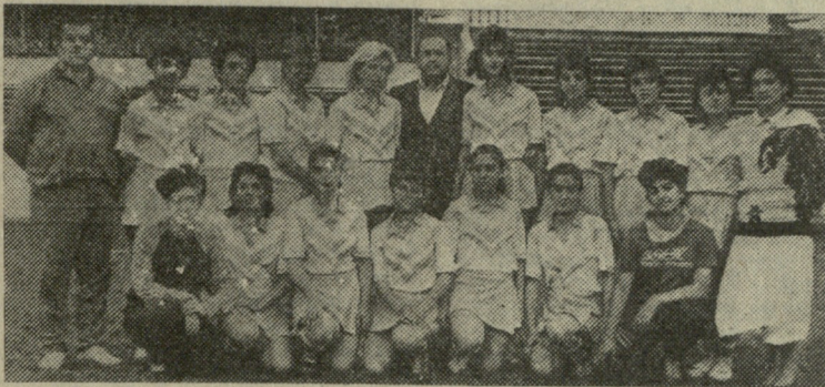
სურათზე: ბალახის პოკისტ გოგონათა გუნდი „ფეიქარი“.