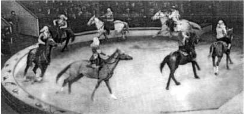
მთჯირთა ცხენისათა ჯგუფი ქერძმ ვარზიევის სულმძღვანელობით