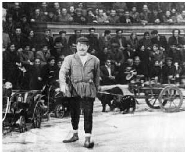
ჯამბაზი, ძველის მწვრთნელი ადგილი ცხომეობა