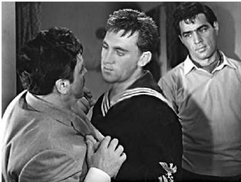
ვლადიმერ ვასოცკი და ოთარ კობერიძე კადრი ფილმიდან "713 ითხოვს დაჯღღმას"

ვარ! Мочкаш, как ты меня был в "713" Больше никому этого не эволю, но с тобой встретился ты даже так. Обнимаю! Владимир Васильевич