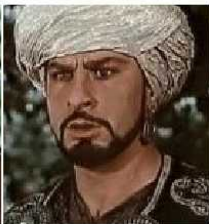
დავით (დოდო) აღმაშენებელი