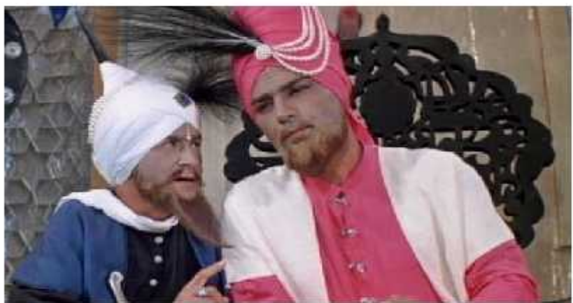
ოთარ კობერიძე კადრი ფილმიდან "ალაღინის ჯადოსნური ლაშქარი"