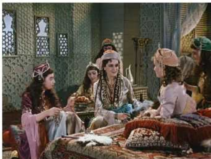
ლას ელსაგა, კაღრა ფელმოდან "მამლექი"