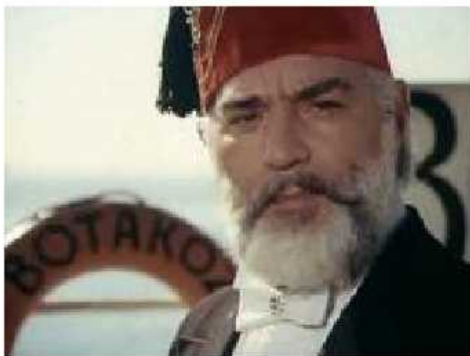
ოთარ კობერიძე კადრი ფილმიდან „ცეცხლოვანი გზები“