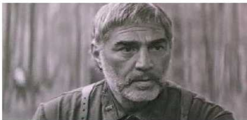
ოთარ კობერიძე კადრი ფილმიდან „ელოდეთ მოკავშირეს“