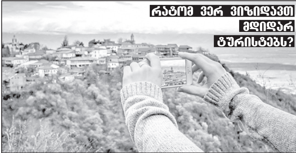
რატომ ვერ ვიზიტორები ვიზიტორებს?