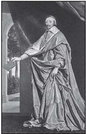
მთაწმადე გივი განმრკველმა

განთქმულ კარდინალ რიშლიეს ჩამოგვალი, ვერცხვი და რიშლიე ყმანელოვრიდან სასიყ-ვერული ინტრიგებში ჩაება. სამეფო პარის განთქმული ლავაზი-ნები განსაქანს არ აქლემდენ და სხვა თანხანისმცოდნეებს ამ-ჯოვრინებდნენ. გოლოს ასეთი თანხანისმცოდ-ნე წარმატება იმით დაითავრდა, რომ ახალგაზრდას განსი-ლიაში ამოყო თაპი, სა-ნიდანაც მიფის ფაშო-რითმა ქალგატონმა მენტონმა რის ვანი-ვაგლებით გამოიყვანა.