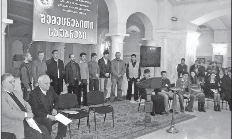
„თაობათა შორის კავშირი, შეხვედრა და საუბრები დიდი საქმის დასაწყისია...“