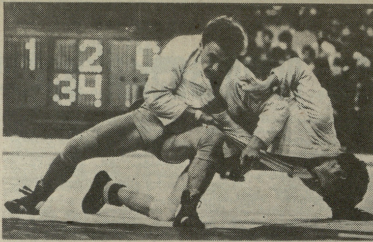
მხოლოდ ბაირაგები უფლება