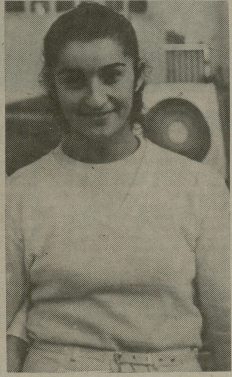
ევროპის ჩემპიონატი მშვილდოსნობაში