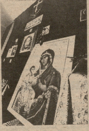
როგორც, სამწუხაროდ, ეს არაერთხელ მომხდარა, მას „პროფილი შეუცვალეს“ და აქციეს: აბანო. — სამწუხაროდ ფაქტი მოწმობს