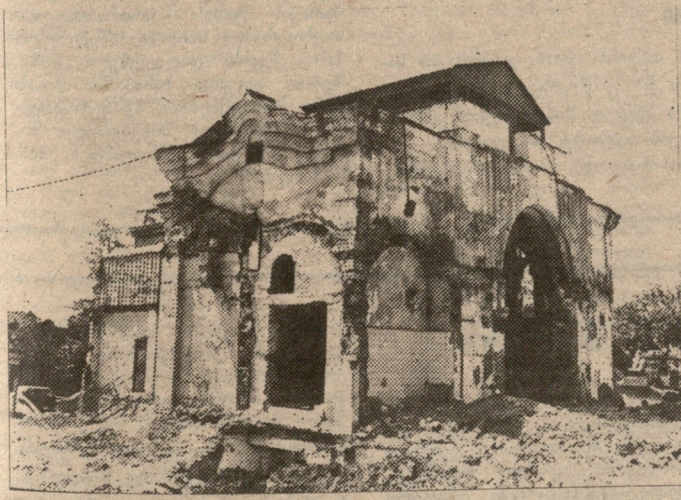
მაშ ასე, გადაწყდა: ირგვლივ მდებარე ტერიტორია მიმარტობულია ივერიის ღვთისმშობლის ეკლესიაზე. ეს ტაძარი, რომელიც