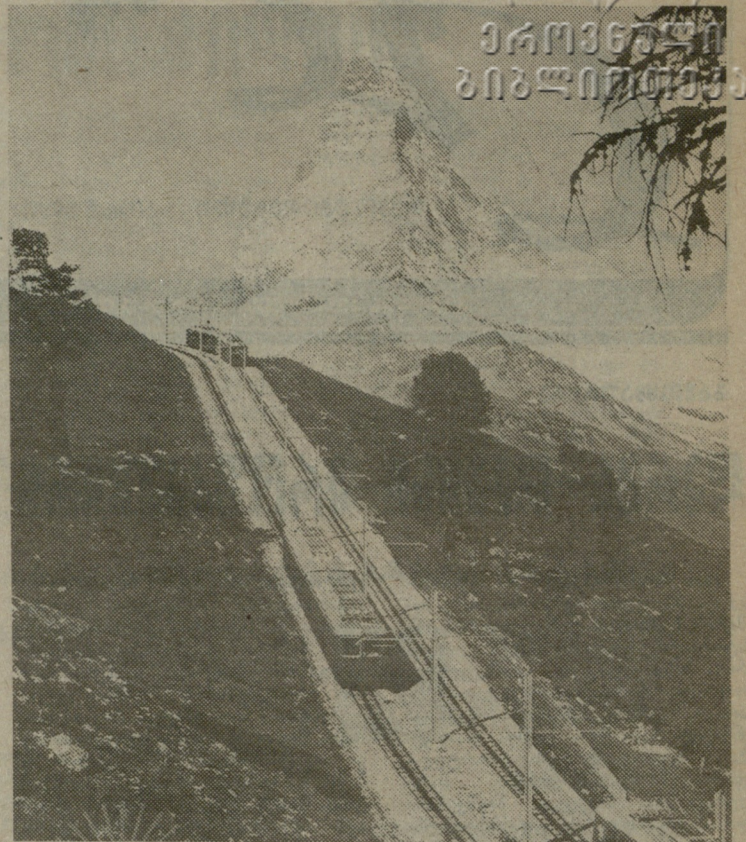
ელექტრომობილური შევიცარიის მთებში.