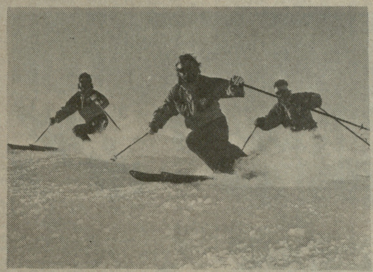
კრანს-მონტანა ჩემპიონატის მონაწილე ურნალისტები.