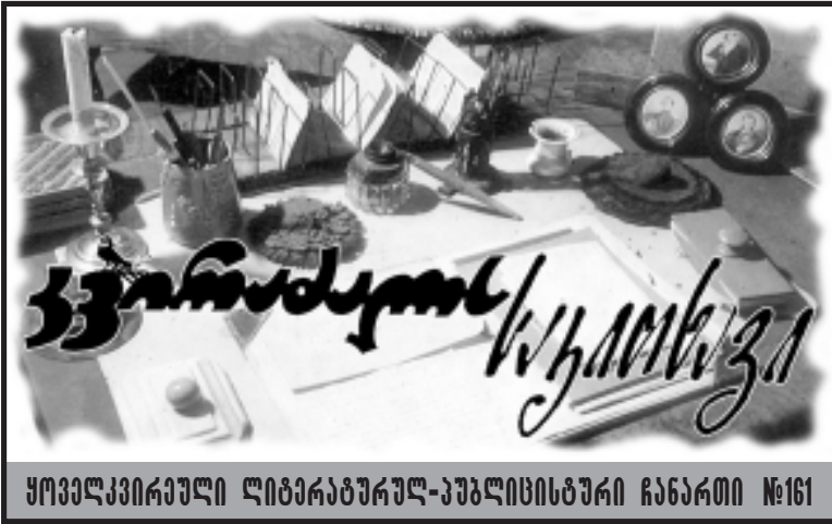
ყოველკვირეული ლიტერატურულ-პუბლიცისტური ჩანაწერი №161