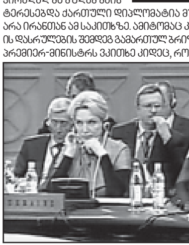
პითოე გარტლას იუზენკოს ჩამოუსვლალოგის ბაგო პრ ჩამოვიდნენ სხვა პრეზიდენტების? - ამის შესახებ განცხადებით...

დღეს, მარტო აზერბაიჯანს შეუძლია მოკლევადიანი ახალი საპარტიო ურთიერთობის აღდგენისთვის მზად იქნება.