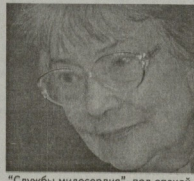
"Служби милосердия", под опекой которой находится народная артистка России. В уголовный розыск

Московская полиция, начавшая в четверг, 18 августа, поиски пропавшей 77-летней народной артистки России Татьяны Самойловой, обнаружила актрису в одном из медицинских учреждений столицы.