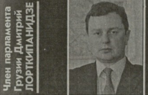
Член парламента Грузии Дмитрий Лордкипанидзе