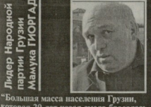
Лидер Народнои партиии Грузии Мамука Гиоргадзе