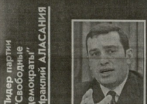
Лидер партиии «Свободные демократы» Ираини Аласаниа