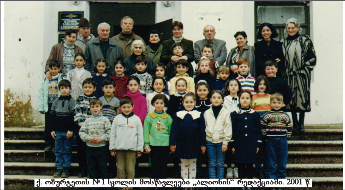
ქ. ომურგეთის №1 სკოლის მოსწავლეები „ალიონის“ რედაქციაში. 2001 წ.