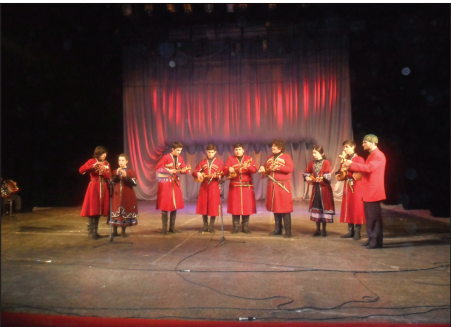
ბათუმში გამართულმა ფესტივალ-კონკურსმა „ჩემი ხატია სამშობლო“ მუნიციპალურ კულტურის ცენტრთან არსებულ ვოკალურ-ინსტრუმენტალურ

ანსამბლს „ედელვაისს“ კიდევ ერთი გამარჯვება მოუტანა.