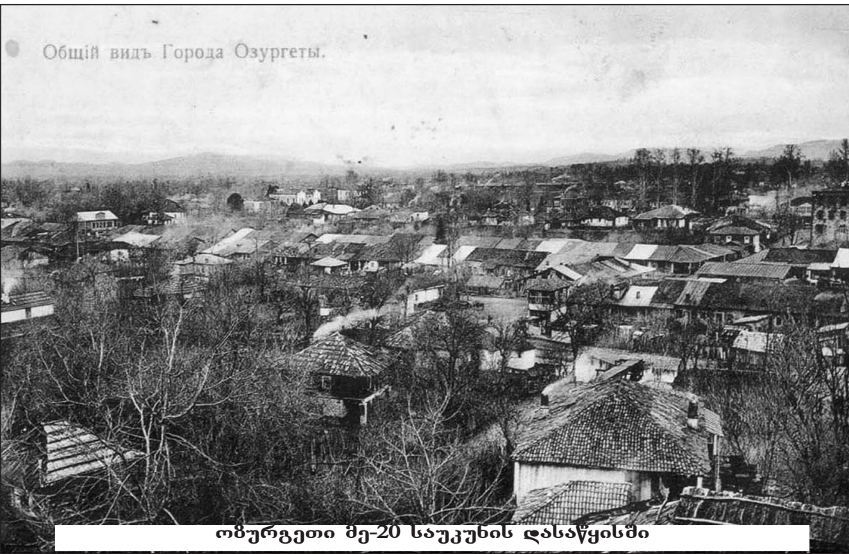
ოზურგეთი მე-20 საუკუნის დასაწყისში

თენგიზ კუნჭულია წიგნში „ქალაქი და ტრადიციები“ აღნიშნავს, რომ „ოზურგეთი, როგორც გეოგრაფიული ადგილის სახელწოდება, გამოდინარობს მისი რელიეფური მდებარეობიდან და იგი ნიშნავს ორ ზურგ შორის მდებარე ტერიტორიას. ჩრდილოეთით ასეთი ზურგი არის მოიდანანგე, ხოლო სამხრეთით კი სერის გორაკები, რაც შემდეგ ოზურგეთად ჩამოყალიბდა“ (თ. კუნჭულია „ქალაქი და ტრადიციები“, ოზურგეთი, 1999 წ. გვ. 2)