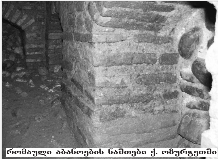
რომაული აბანოების ნაშთები ქ. ოზურგეთში

გვიან შუა საუკუნეების ხანაში, ოზურგეთი გურიის სამთავროს ადმინისტრაციულ-პოლიტიკური ცენტრი და კულტურულ საგანმანათლებლო კერაც იყო. გურიელების სასახლეში ამრავლებდნენ ხელნაწერებს, ამზადებდნენ ახალ ნუსხებს. აქ