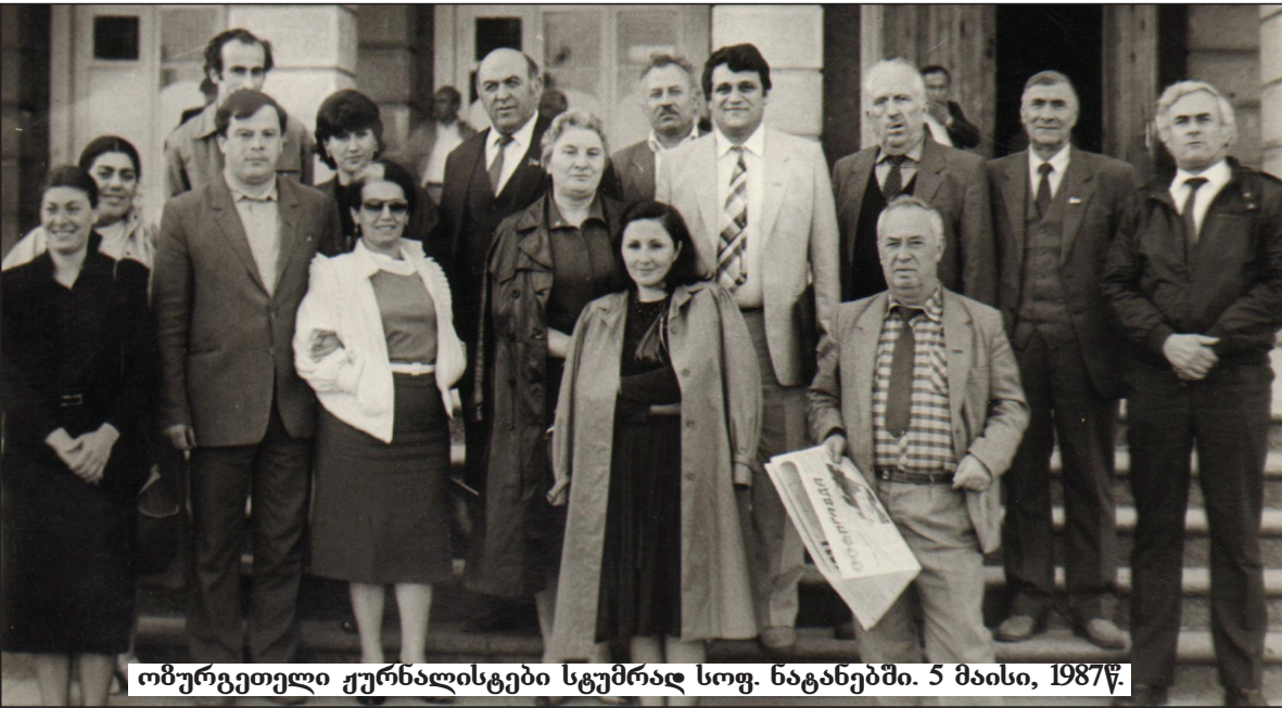
ომურგეთელი ჟურნალისტები სტუმრად სოფ. ნაგანებში. 5 მაისი, 1987წ.