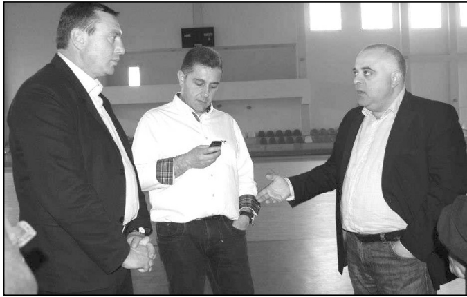
ოზურგეთის მუნიციპალიტეტში სტუმრობისას სპორტისა და ახალგაზრდობის საქმეთა

მინისტრი ლევან ყიფიანი ოზურგეთის მუნიციპალიტეტის გამგებელ კონსტანტინე შარაშენიძეს და სპორტის სამსახურების ხელმძღვანელს შეხვდა და სხვადასხვა პროგრამებზე ისაუბრეს. მან სხვა სპორტულ ობიექტებთან ერთად ოზურგეთის ცენტრალური სტადიონი მოინახულა.