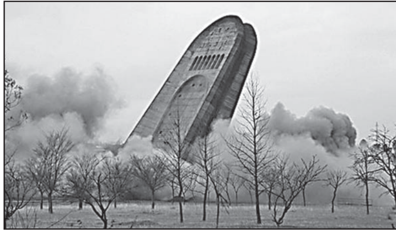
იხ. 6 გვ.